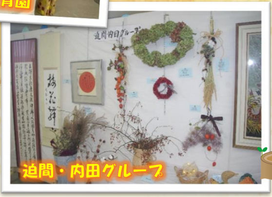
迫間・内田グループ