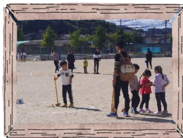
▽▽▽▽▽▽▽▽▽▽ 三重中央支部社協主催 スポーツと文化の祭典 △△△△△△△△△△