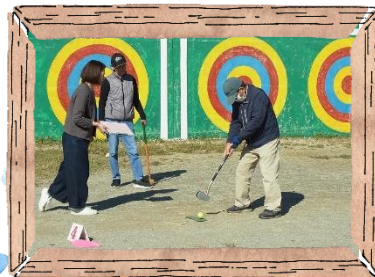
▽▽▽▽▽▽▽▽▽▽ 三重北社協主催 グラウンドゴルフ大会 △△△△△△△△△△