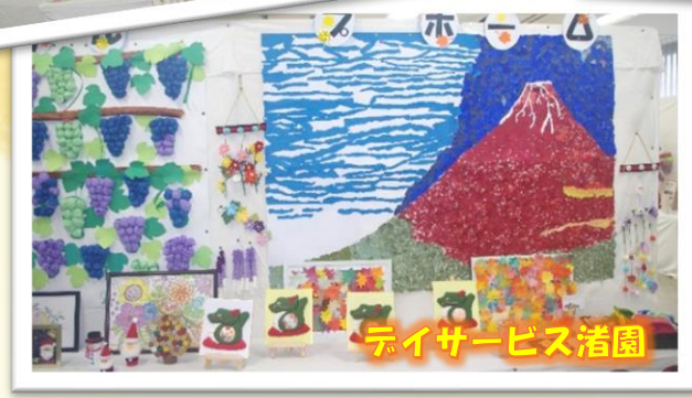
デイサービス渚園