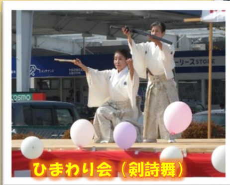
ひまわり会 (剣詩舞)