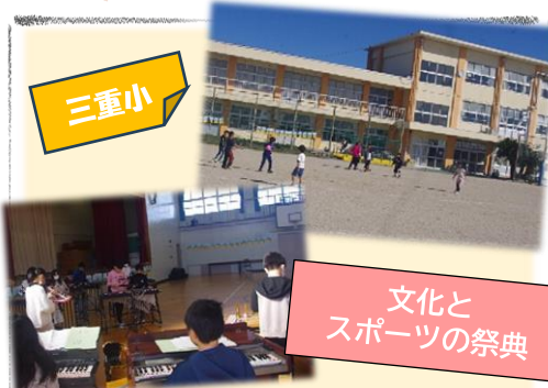
文化とスポーツの祭典

三重小5年生による演奏会でスタート！グラウンド・ゴルフやドッジボールの他、ヨガや吹き矢など、多くの方が珍しい競技にも挑戦しました。