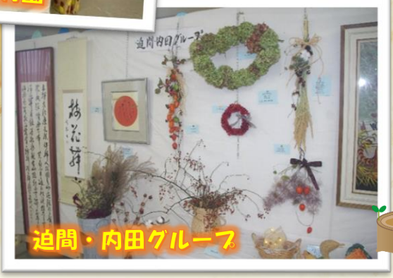
迫間・内田グループ