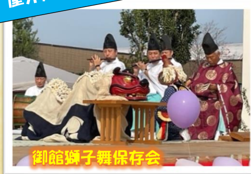
御館獅子舞保存会