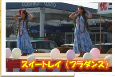
スイートレイ (フラダンス)