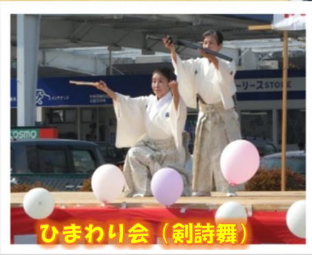
ひまわり会 (剣詩舞)