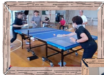
市内で行われた体験会の様子

ボッチャ同様、当地区でも、今後、体験会が実施される見込みですので、ぜひ挑戦してみてください。