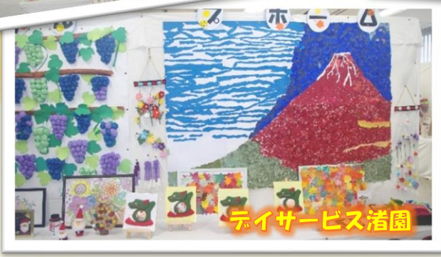
デイサービス渚園