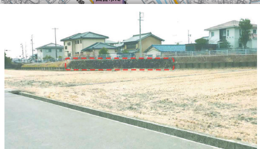
矢ノ根川 砂防堤防 (石垣部が平成2年決壊し、修復された) 石垣上部にひび割れがある