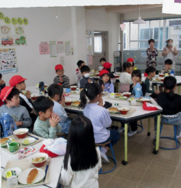
給食でスマイル交流♪ 三重北小と八郷西小