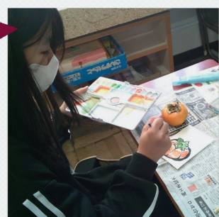
地域の方が先生 絵手紙クラブ / 三重西小