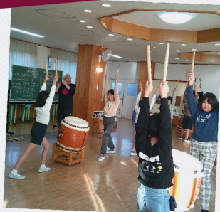
迫力満点！御諏訪太鼓 / 三重西小