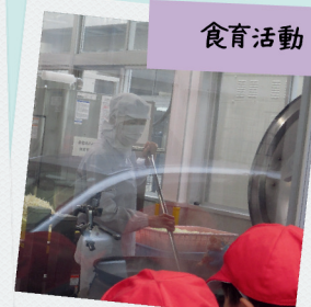
給食室見学！大きななべがみえる～