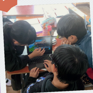
ひとり一台、タブレットを活用した班学習