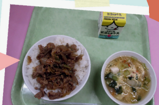
三重豚丼とかきたま汁